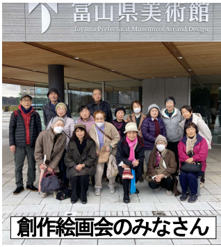
創作絵画会のみなさん

百鼻心も食わぬと友は謙る一キロもあるシャインマスカットくれて 完璧な貴方の不在はこんなにも容赦のなくて絶対の不在 我を待つ母を待たせて月の夜虫の音小さく母の声還る 帰りきてまず神仏に手を合やす庭のコスモス風に吹かれて 大笑いしつつ高齢者だから自虐ネタ幼馴染みとつい長電話