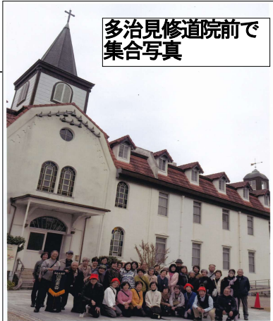
多治見修道院前で集合写真

冬帽子親しき友に気づかれず ハラハラと落ち葉の命次世代へ ビル風も木枯らしとなり衿を立て 初雪や井戸端会議にかしましき 裸木の雨粒ひかる並木道