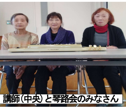
講師(中央)と琴路会のみなさん

会。以前は老人ホームへの慰問などの活動をしていましたが、コロナ禍を経て一変しました。私はコロナ禍中の入会なので、検温やマスク着用など緊張感の中での活動でした。そんな時こそ大正琴の音色が心の癒しとなり、ストレス解消になっ