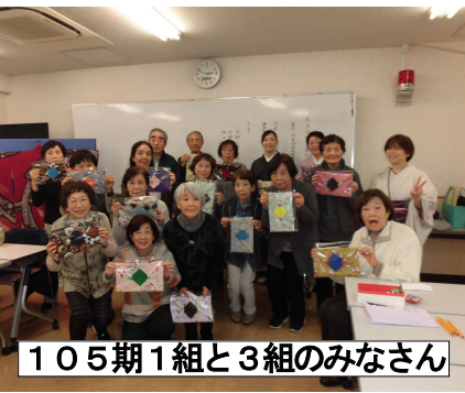
105期1組と3組のみなさん

終わってみれば、皆さん大変楽しかったとの感想でした。指導の先生方は、日頃は若い人を教えているの