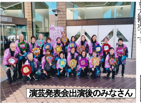
演芸発表会出演後のみなさん

【おさらい会スケジュール表】これまでの課題曲の練習10:00~11:30(どなたでも参加自由)