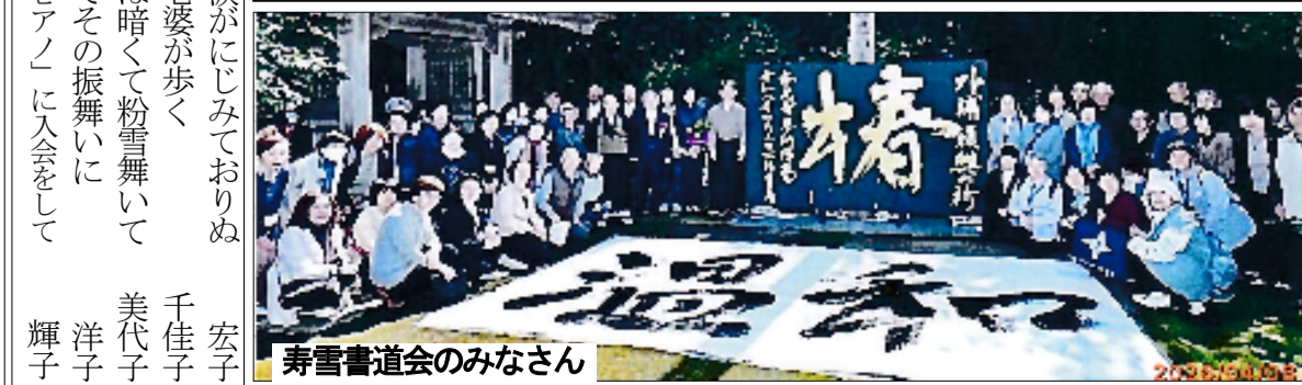
寿雪書道会のみなさん

歌会を休み(歌会始め)見つづつしか涙がにじみ出ておりぬ車より眺めておれば黙々と雪降る車道を老婆が歩く友達じゃないといわれた去年の夏思い出は暗くて粉雪舞いておだやかで優美な姿の友に会う心とられてその振舞いにマイピアノ長き眠りをやっと終えぬ「らくらくピアノ」に入会をして