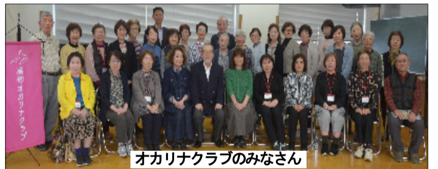
オカリナクラブのみなさん

研修旅行、コーヒーとケーキの歓迎会、クリスマス懇親会等を楽しんでいます。 ◇人生の時間を、興味のあることや好きなことを、気の合った他人と少しずつ共有することができたなら、それは大きな幸福であり成功なのだと思います。「好きなことがある幸せ、それができる喜び、好きなことを共にできる仲間が近くにいる!!」これ以上の幸せはありません。 ◇高砂オカリナクラブの例年の練習や何気ないやり取りといった些細なことを通じて、このクラブで結ばれた縁(えにし)に感謝をしながら、今日も例会を終えました。